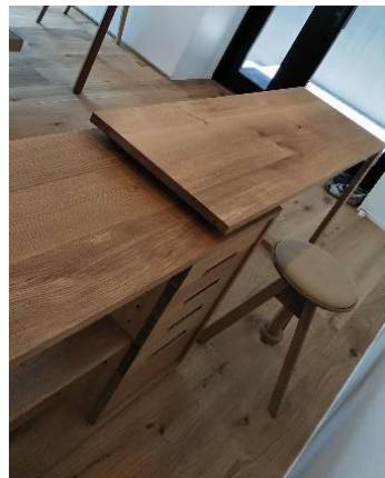
↑カウンターテーブル

入口から見て、右手に展示棚(移動不可)、左手にカウンターテーブル(移動可)があります。